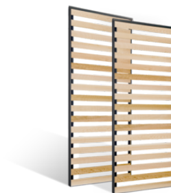
VOLETS COULISSANTS LAMES FLAT EN BOIS EN SAVOIR PLUS